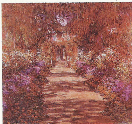
Entrada principal de Giverny sob o olhar de Monet pintor, Le Jardin à Giverny .

M ANHÃ DE SOL. Pegar o trem na Gare Saint Lazare, margeando o Sena, durante uma hora, com destino a Vernon. Cruzar o rio em direção a Giverny. Chegar na casa cor-de-rosa de janelas verdes e entrar no mundo colorido em que Claude Monet viveu de 1883 até sua morte, em 1926.