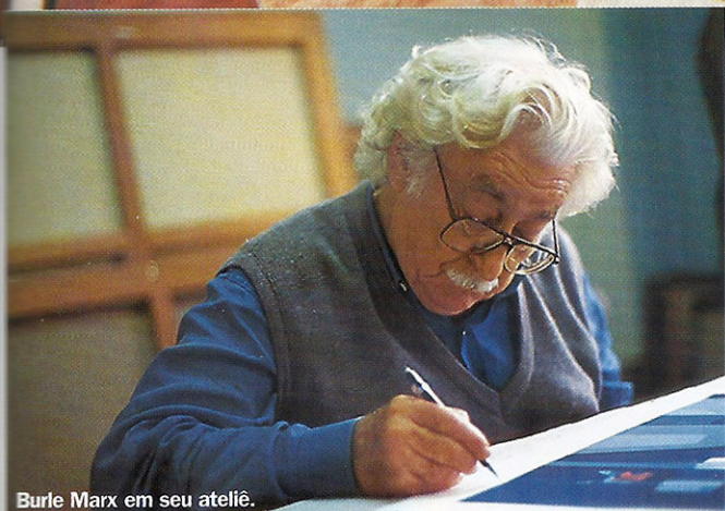
Burle Marx em seu ateliê.