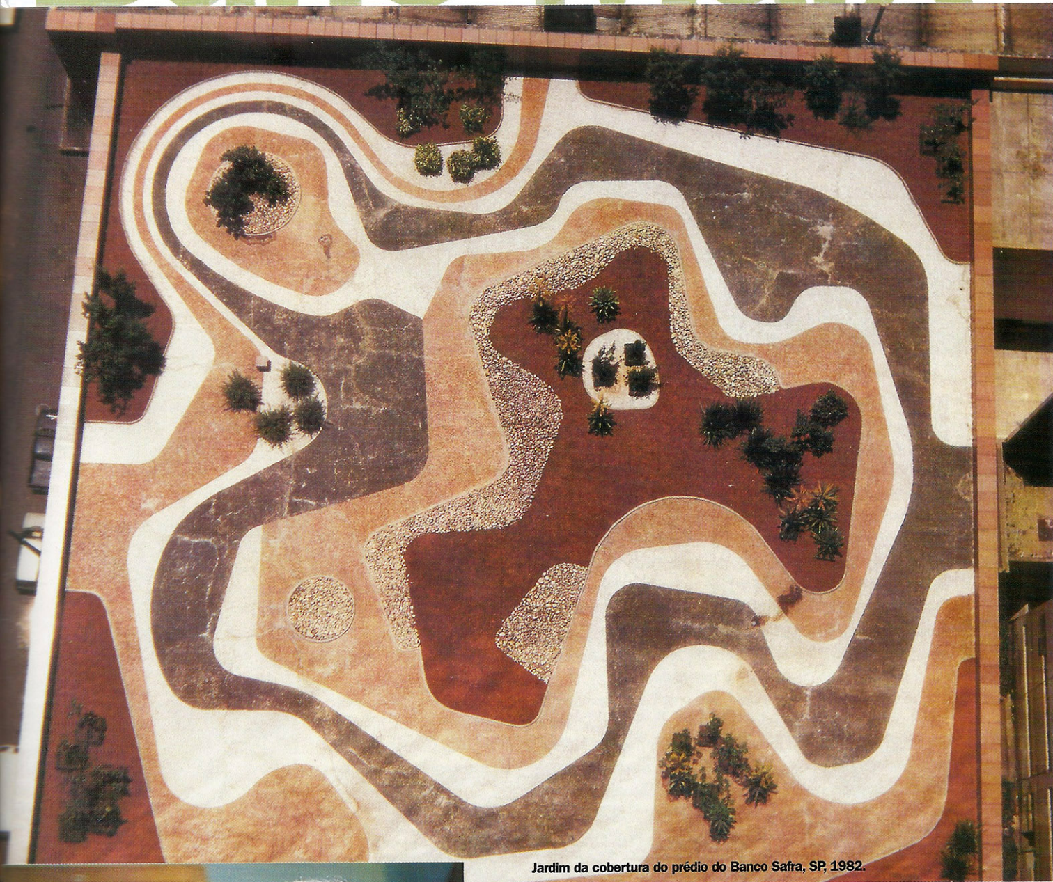
Jardim da cobertura do prédio do Banco Safra, SP, 1982.