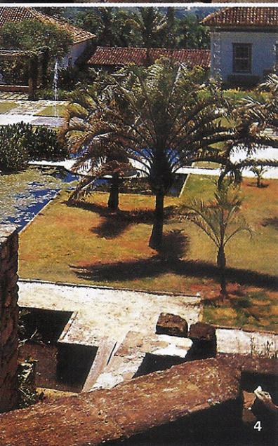
1. Tapete de grama do Museu de Arte Moderna, RJ, projeto de 1954. 2. Parque Roberto Burle Marx. 3. Jardim Escultura no MAM, 1954. 4. Fazenda Vargem Grande, 1990. 5. Sítio Burle Marx com estruturas de pedra de cantaria.

Um passeio com Burle Marx no seu sítio, no fim da tarde, após um almoço generoso, daqueles que deixa o sabor no coração, era um ritual que cultuava a natureza. Ali priorizou ao longo de sua vida a formação de uma importante e única coleção de plantas nativas e associações vegetais, deixando para as futuras gerações um elenco inestimável de espécies de nossa flora, que sempre lutou para proteger. Era implacável com os destruidores de florestas, e um militante incansável na preservação do nosso patrimônio vegetal. (Continuação no final da revista)